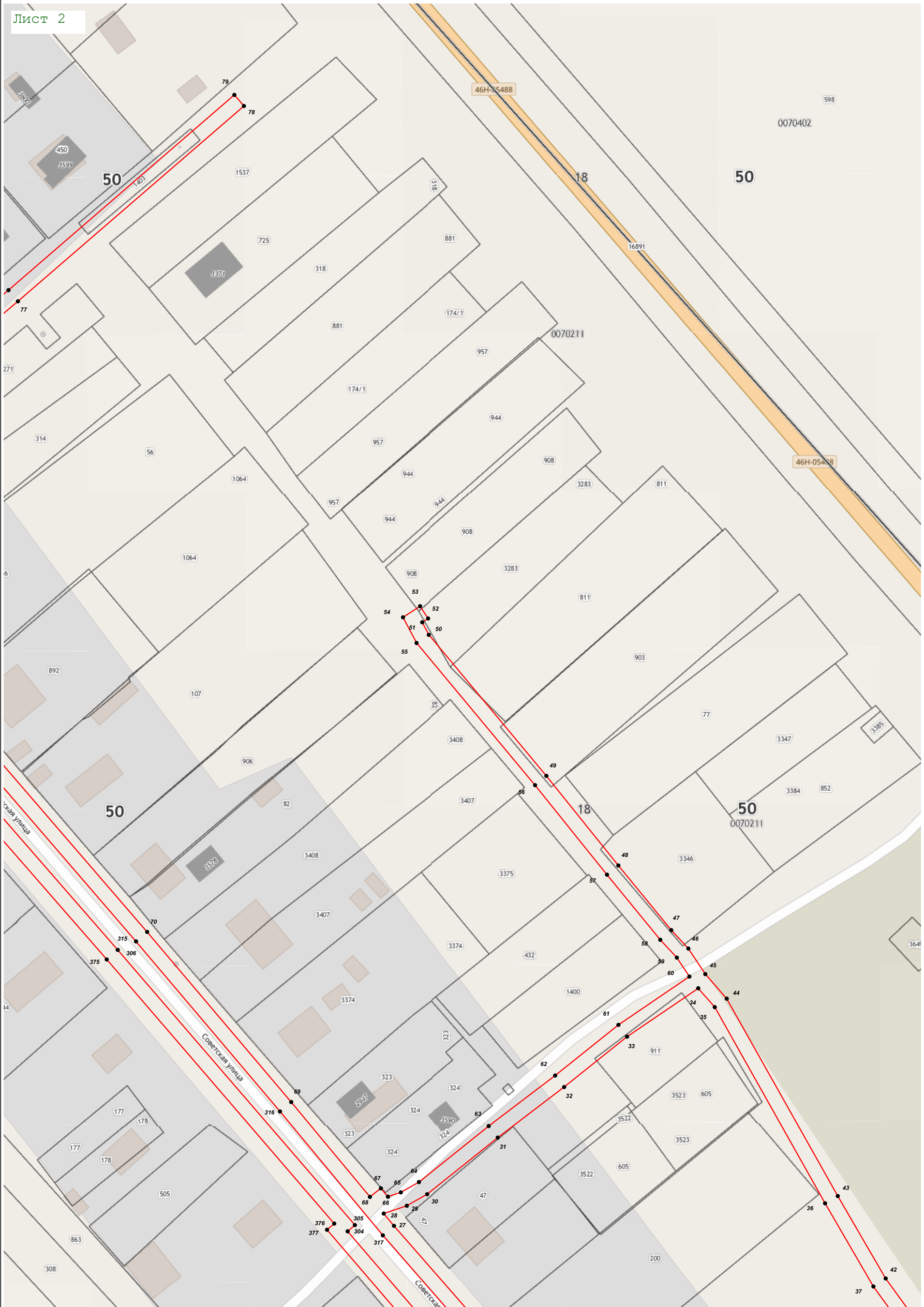
Масштаб 1:1 000